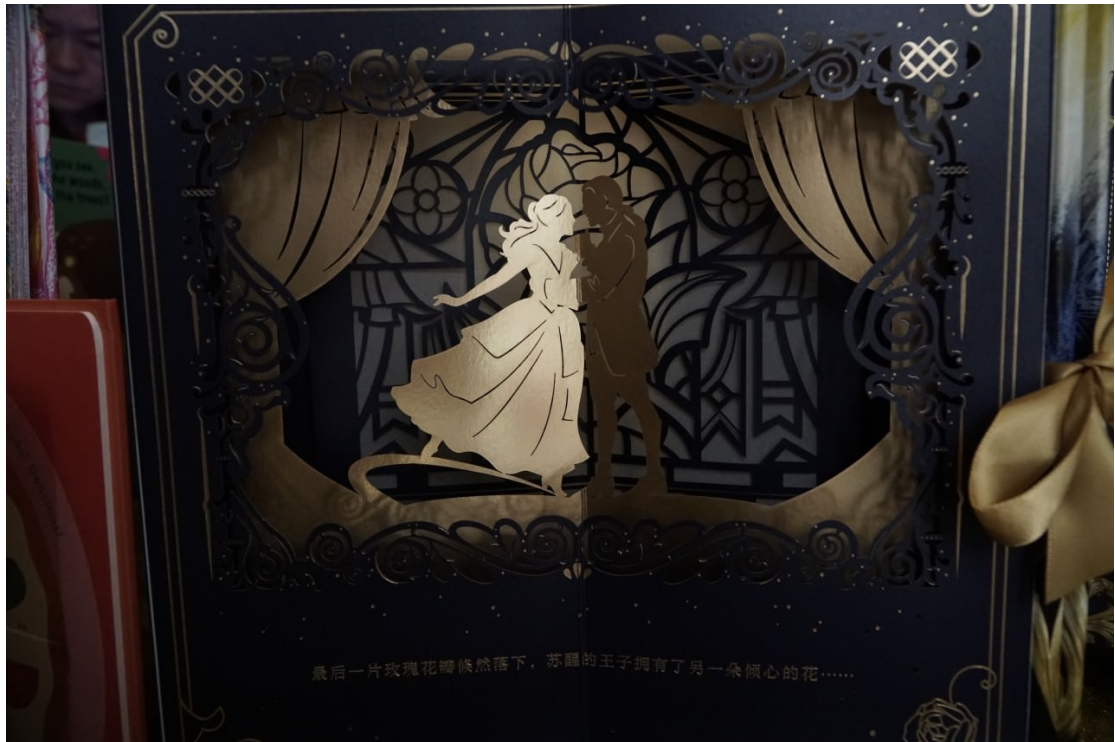
華商印刷不少立體書，香港和中國都是印刷樞紐。