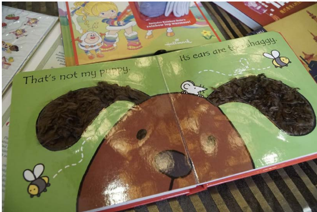
▲外國兒童書用各種材質製成。

毛毛、凹凸、膠片，兒童書的質感比從前更多元化。其中由大陸出版的立體書《美女與野獸》更加上燈光剪影，獲得三個印刷大獎，包括中華印製大獎金獎、美國金墨獎金獎，以及印刷界最具權威的獎項：美國印刷工業聯會美國印刷大獎賽班尼獎。而負責印刷的，正是港商鶴山雅圖仕印刷有限公司。這本書只有六面，但鏤空設計和每頁內置光源，製作上來一點都不簡單。