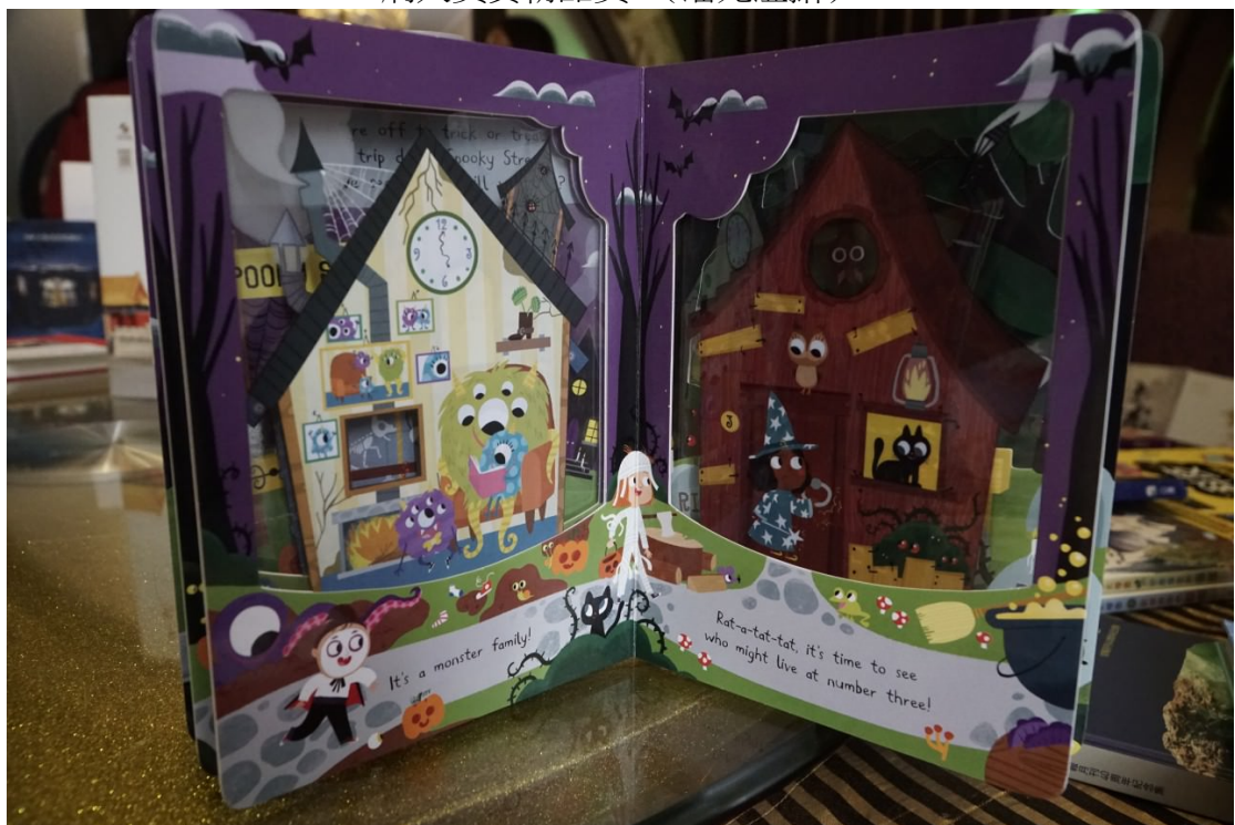
▲膠片防水，疊起來又有不同的圖案。