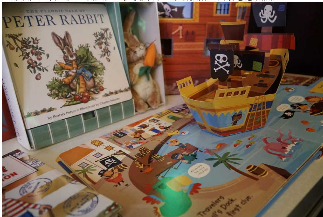
▲ 立體書造工複雜，相當於一門工藝。

7%。而且隨兒童書愈來愈精美，推動印刷業發展更多更新的印刷技術，如全息攝影技術（Holography，紀錄和複製立體物件全像），是香港目前的大趨勢。香港印製兒童書，兒童書又進一步提升香港印刷技術，兩者息息相關。