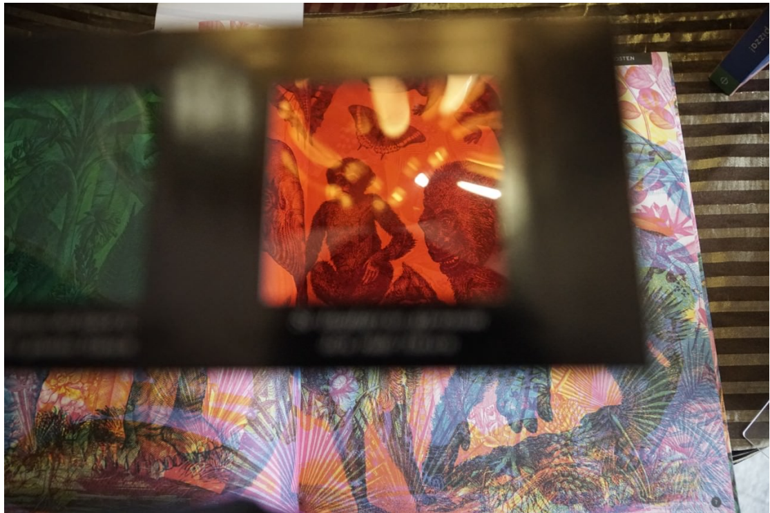
▲不同顏色的鏡片城看到書中不同的圖案。此書獲得美國印刷工會聯會美國印刷大獎賽精品獎。